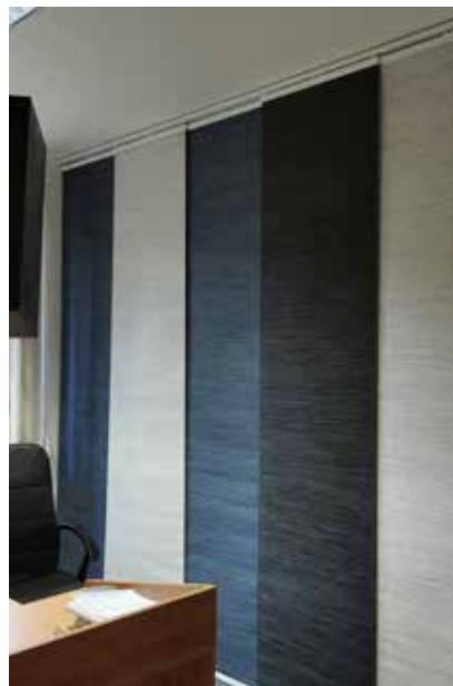
▲ A zde výsledek Petrova snažení.