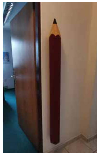
▲ Kancelář šéfredaktorky Kateřiny Hodecové už identifikujete snadno.