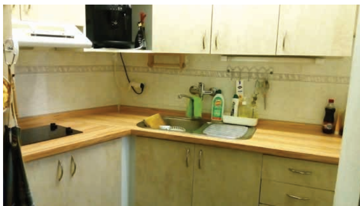
Naše nová kuchyňská linka, kterou nám o prázdninách namontoval a novým vaříčem vybavil Petr Hodec.