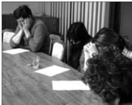
Polední společná modlitební chvíle týmu