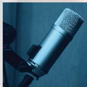
Dlouho očekávané: Celodenní vysílání do finíše