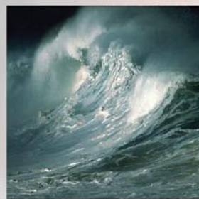
Seriál Otakara Vožeha: V Bohu není bezpečí