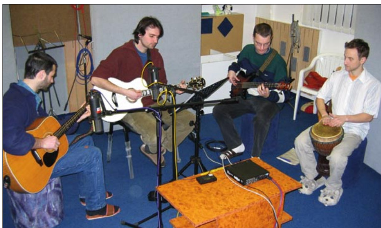
V hudebním studiu TWR-CZ dokončuje své jarní hudební album skupina Bétel.