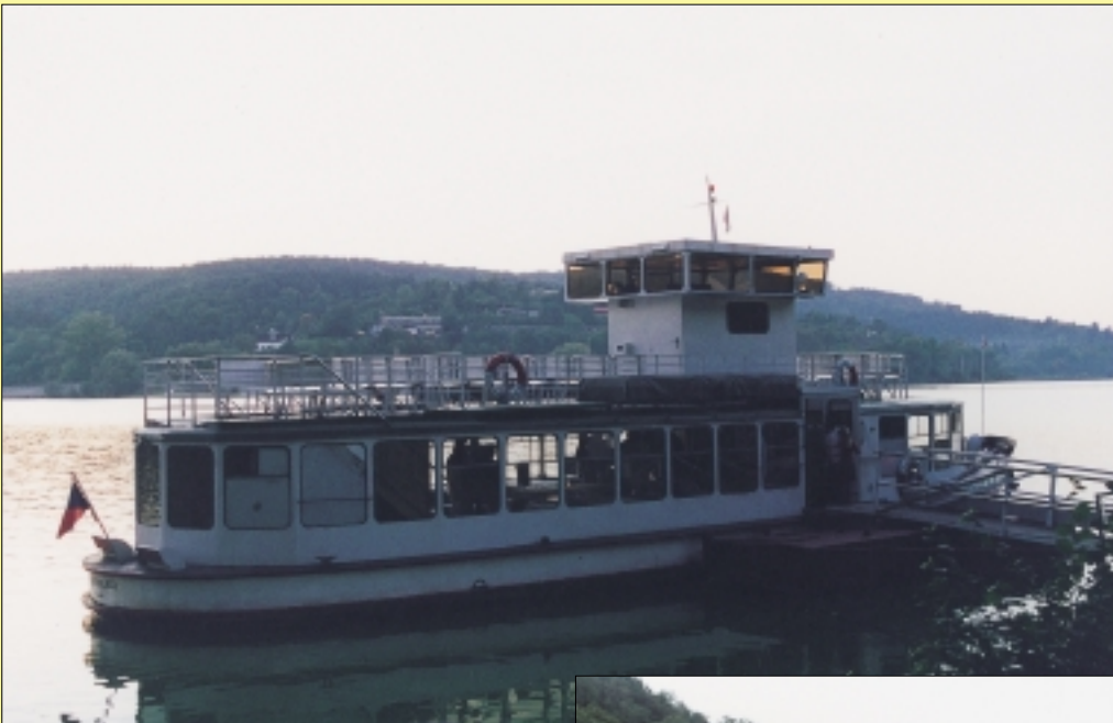
Lod Bratislava, která s 60 spolupracovníky TWR-CZ brázdila vody brněnské přehrady. Z horní paluby jsme obdivovali krásy přírody, uvnitř bylo malé pohoštění a hudba.