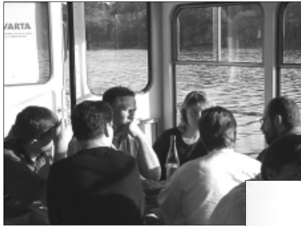
V průběhu plavby byl čas hovořit nejen o pracovních záležitostech.

Podávání novinových zásilek povoleno Jihomoravským ředitelstvím spojů v Brně pod. čj. P/3-8636/91, ze dne 5.8.1991 Neprodejně